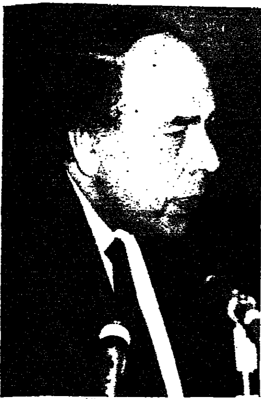
منصور الرجباني - الشاعر